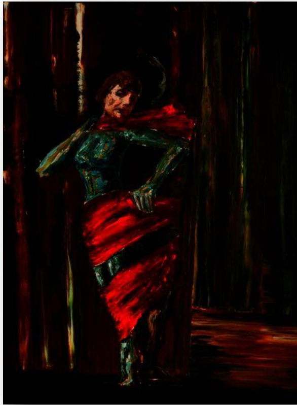
Cassé / Zerbrochen, 2013, 100cm x 90cm, Öl auf Leinwand.