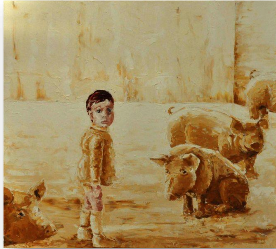
Der weisse Raum, 2014, 90cm x 100cm, Öl auf Leinwand. In Privatbesitz.