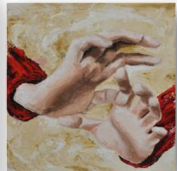
Hände in Beige, 2015, Öl auf Leinwand, Triptichon, Gesamtmaße 70cm x 185cm.